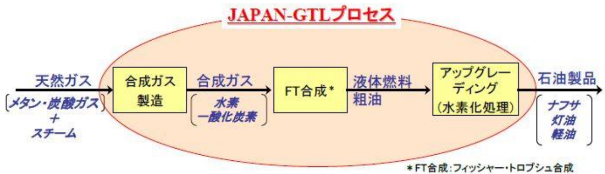
図 1 JAPAN-GTL プロセスの製造フロー

GTL とは、天然ガスから、化学反応によってナフサ、灯油、軽油等の石油製品を製造する技術のことです。JAPAN-GTL プロセスは、天然ガス中に含まれる二酸化炭素(CO2)を原料としてそのまま利用することが可能な世界初の画期的な技術であるため、放出する CO2 を減らし環境負荷を軽減します。世界に広く賦存する、天然ガス、シェールガス等から、硫黄分及び芳香族を含んでいないクリーンなナフサ・灯軽油等の石油製品を製造することが出来るようになり、新たな液体燃料資源確保の道を開くとともに、エネルギー安全保障に貢献する技術です。